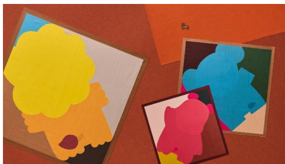
スカーフ (4種 : らいおん・かぼ・ぞう・ワンポイント)

グラフィカルなデザインの4種のスカーフ。スカーフとしてだけでなく、ヘアアクセサリやバッグに巻くなど、カラフルな色味で普段のファッションのアクセントに。