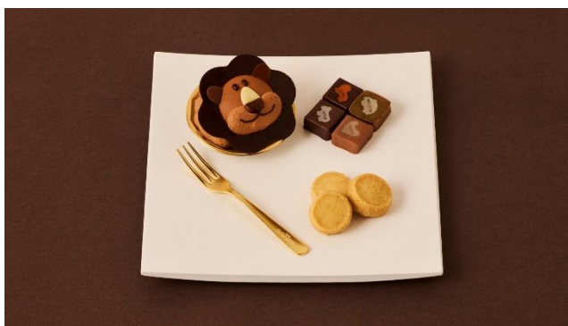
①-A いおんくんケーキセット:5,500円(税込)