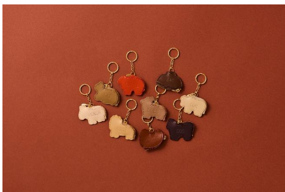
コインケース (9種 : BAT・CAMEL・CAT・COW・DEER・DOG・HORSE・LION・M,DUCK)

小物を収納できるコインケース。上質なレザーを使用し、9種の高級感あるカラー展開に。キーホルダーとしてもかわいいアイテム。