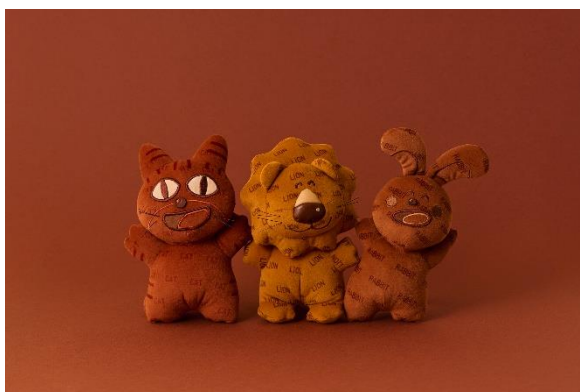
ぬいぐるみ(3種 : らいおん・うさぎ・ねこ)

モノグラムを施したベロア調のぬいぐるみ。大人の「たべっ子どうぶつ」をテーマにした特別なカラーで、らいおん・うさぎ・ねこのラインナップ。