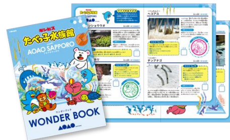
【「ワンダーブック」※イメージ】