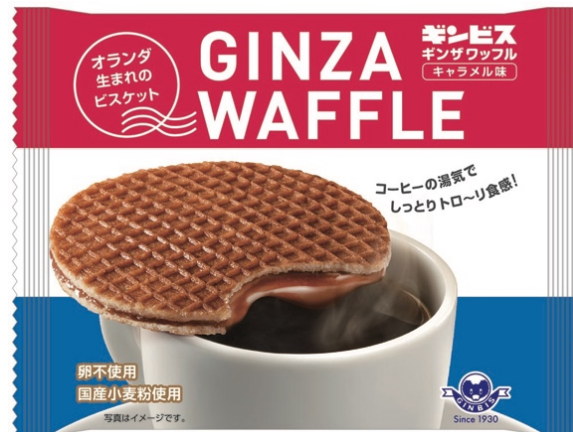
ギンザワッフル キャラメル味