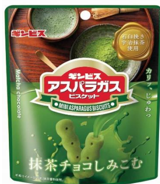
抹茶チョコがしみこんだミニアスパラガス 37g