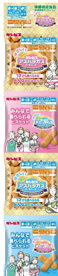
やさしいミニアスパラガス 4連