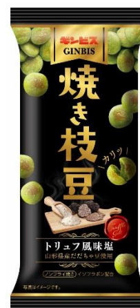
焼き枝豆 トリュフ風味塩