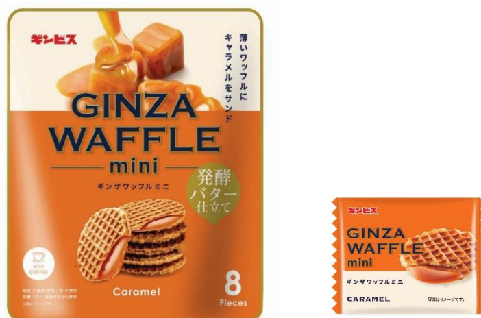
ギンザワッフル ミニ / (個包装)