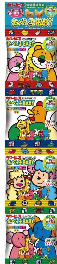
たべっ子 BABY 4 連