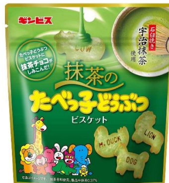
抹茶のたべっ子どうぶつ