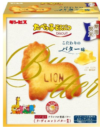
たべっ子どうぶつこだわりのバター味