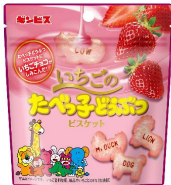
いちごのたべっ子どうぶつ