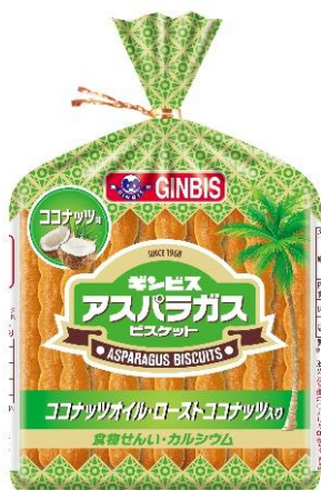
アスパラガス ココナッツ味