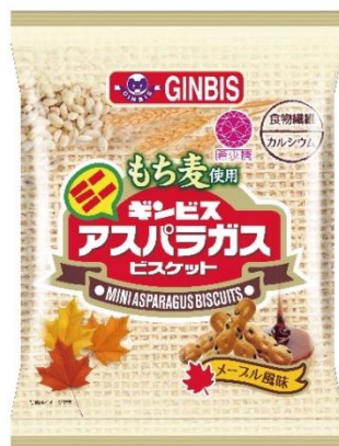
もち麦使用ミニアスパラガスメール風味 65g