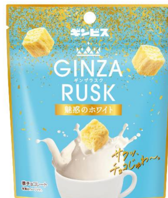
GINZA RUSK 魅惑のホワイト