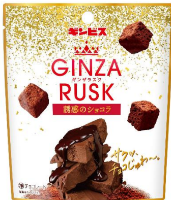
GINZA RUSK 誘惑のショコラ