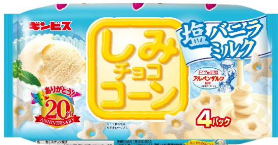
しみチョココーン 塩バニラミルク 4パック