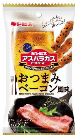
ミニアスパラガスおつまみベーコン風味