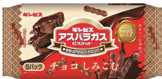
チョコがしみこんだミニアスパラガス 25g/40g/5P