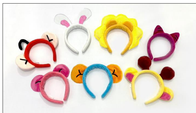
おみみカチューシャ&チケット：2,800円 (7種：さる・うさぎ・らいおん・ねこ・かば・ぞう・きりん)