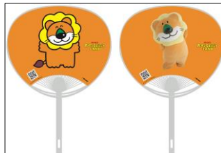
【グッズ購入特典】 「たべっ子どうぶつ」ソロラちわ (全 9 種ランダム) ※グッズ 1,500 円(税込) ご購入ごとにプレゼント