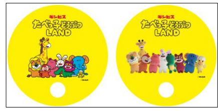
【カフェ特典】 『たべっ子どうぶつ LAND』 オリジナルらちわ (集合 1 種) ※フード&ドリンク 1,500 円(税込) ご購入ごとにプレゼント