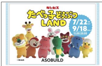
【入場特典】 『たべっ子どうぶつ LAND』 オリジナルポケットティッシュ

『たべっ子どうぶつ LAND』に来場いただいた方の特典として、かわいいノベルティグッズをご用意。