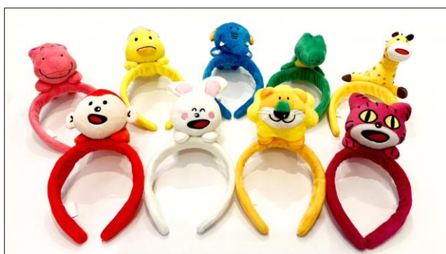
ぬいぐるみ付きカチューシャ&チケット：3,000円 (9種：かば・ひよこ・ぞう・わに・きりん・さる・うさぎ・らいおん・ねこ)