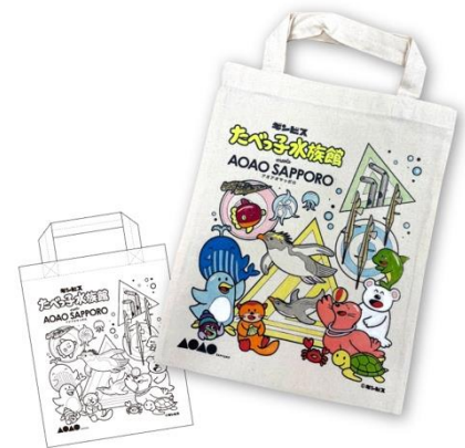
【限定オリジナルトートバッグ※イメージ】