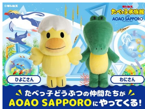
【「たべっ子どうぶつの仲間たち」※イメージ】