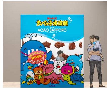
【フォトスポット※イメージ】