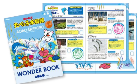
【「ワンダーブック」※イメージ】