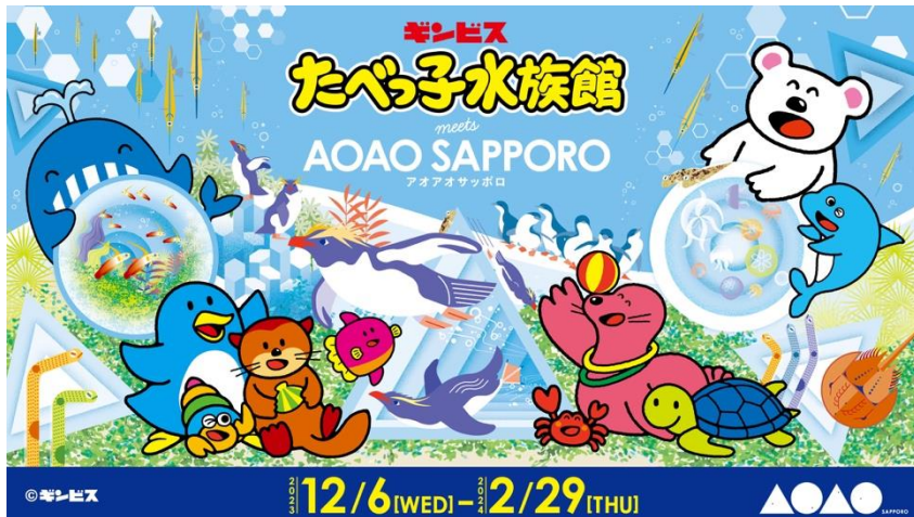
【「たべっ子水族館 meets AOA SAPPORO」※イメージ】