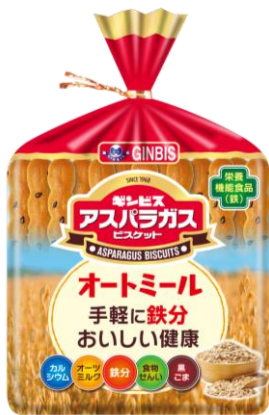
アスパラガス オートミール 125g