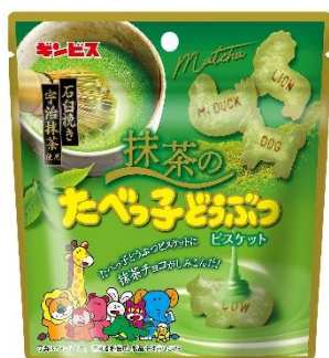
抹茶のたべっ子どうぶつ 40g