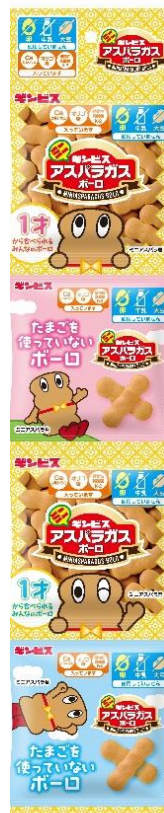
ミニアスパラガス ポーロ 4 連