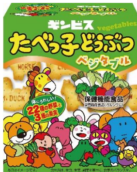
たべっ子どうぶつベジタブル 55g/5P