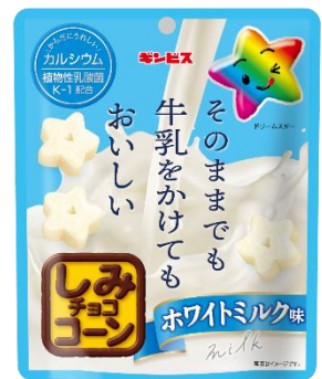
そのままでも牛乳をかけてもおいしい しみチョココーン ホワイトミルク味 50g